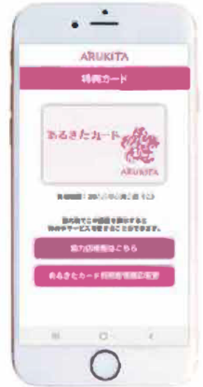
※特典カードイメージ